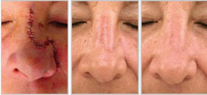
Resultaat acne littekens na Profractional behandeling gecombineerd met de Contour TRL